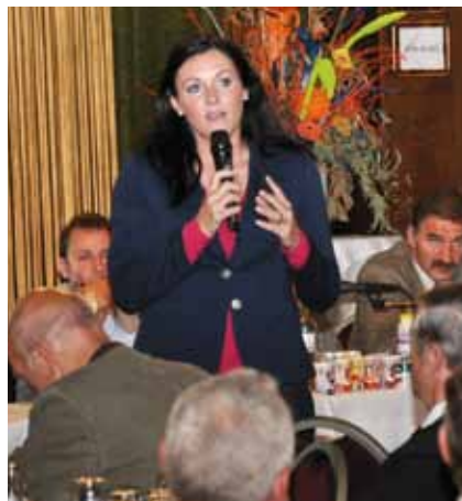
EU-Abgeordnete Elisabeth Köstinger

A m Freitag, dem 9. September 2011 fand die 12. ordentliche Generalversammlung der MGN im Gasthaus Steinberger in Altlenzbach statt. Neben den zahlreich