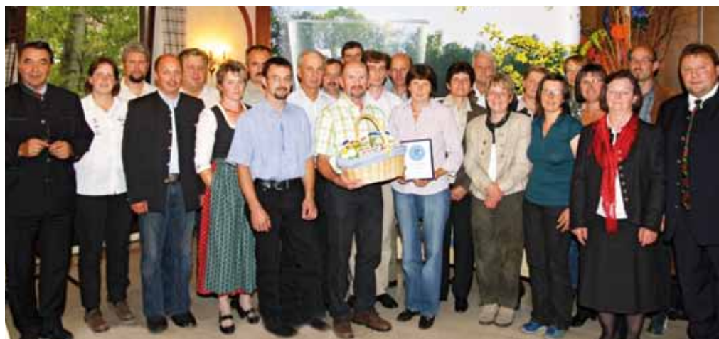
Die 25 besten Milchlieferanten im Jahr 2010

Seitens der NÖM AG wird aufgrund der sehr angespannten Marktsituation ein Kostenrestrukturierungsprogramm umgesetzt. Mit September 2011 wurde der Marke NÖM ein neues, erfrischendes Erscheinungsbild gegeben. Im Zuge der stattgefundenen